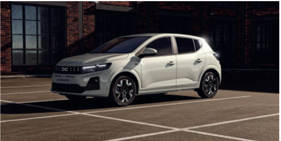
Dacia Sandero (Symbolbild)